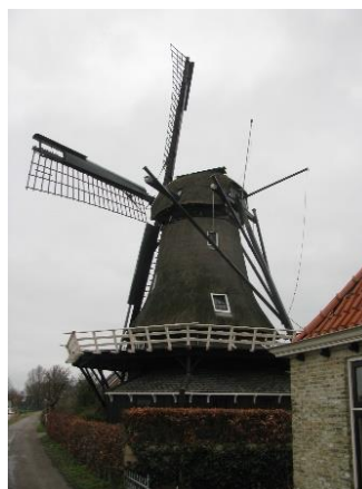
Witmarsum korenmolen De Onderneming.