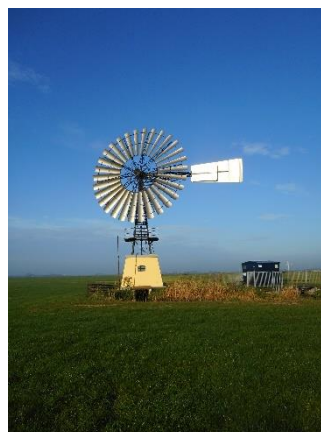
Tjerkwerd molen Jousterp.